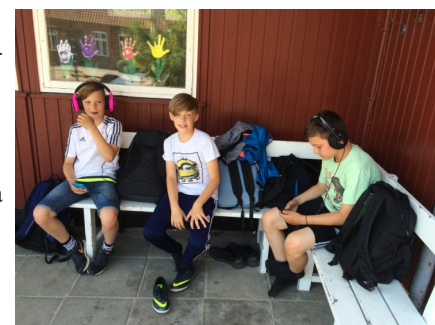
...mens vi venter på bus-sen.

Personalet på Vilsted Friskole ønsker jer en rigtig god weekend!